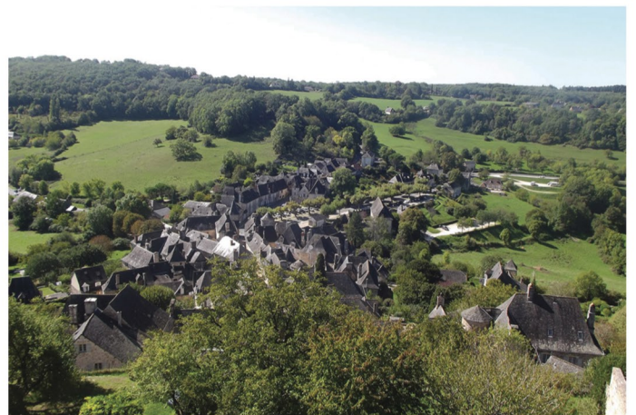
Parcours testé le 18 septembre 2025

Pour plus de détails, n'hésitez pas à contacter Francis